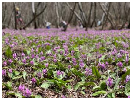
一面に広がる群生地