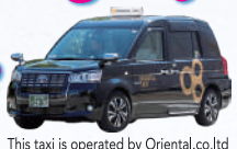
This taxi is operated by Oriental.co.ltd

Direct from Kanazawa Station to the ski slopes in a private car for each group!