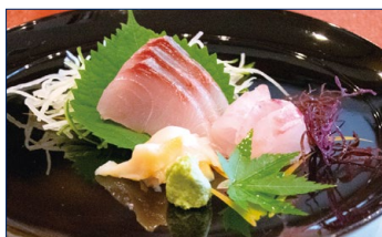
※料理画像はイメージです。