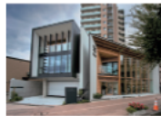
▲ HOKUBI KANAZAWA

HOKUBI KANAZAWA、清水建設株式会社北陸支店、尾山神社授与所、松の湯、金沢商工会議所、金沢市文化ホール、学生のまち市民交流館など