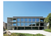
▲ 清水建設株式会社北陸支店