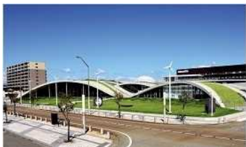
サイエンスヒルズこまつ