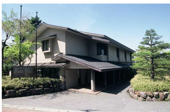
金沢卯辰山工芸工房