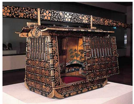
蒔絵梅鉢紋女儀神輿 まきえうめばちもんによぎみこし