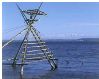
ボラ待ちやぐら(穴水町)