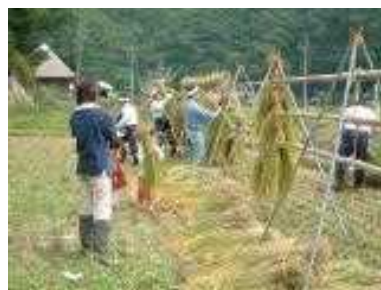
春蘭の里農村体験