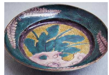
古九谷「青手芭蕉図平鉢」