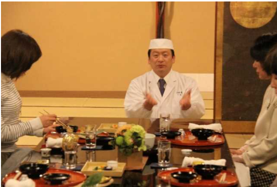
つば甚料理長の解説