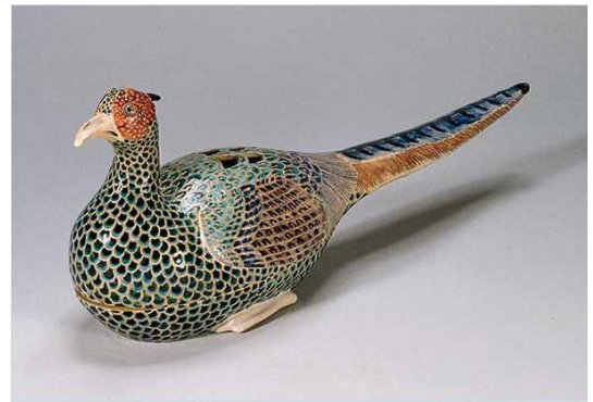
色絵雉香炉 いろえきじこうろ