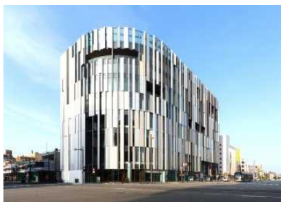
富山市ガラス美術館

世界的な建築家隈研吾氏設計の富山市ガラス美術館をはじめ、妹島和世氏と西沢立衛氏によるユニットSANAA設計の金沢21世紀美術館などの現代建築と、世界遺産白川郷や飛騨高山・金沢東山ひがしなど3か所の重要伝統的建造物群保存地域で歴史的建築を学びます。金沢職人大学校では職人との交流と実践を交えた技術指導もあり五感を刺激する学習内容です。