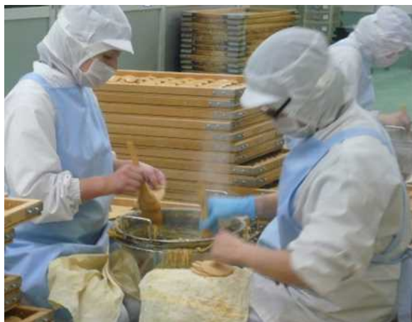
柴舟小出いなほ工場