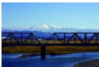
手取川河口からの白山