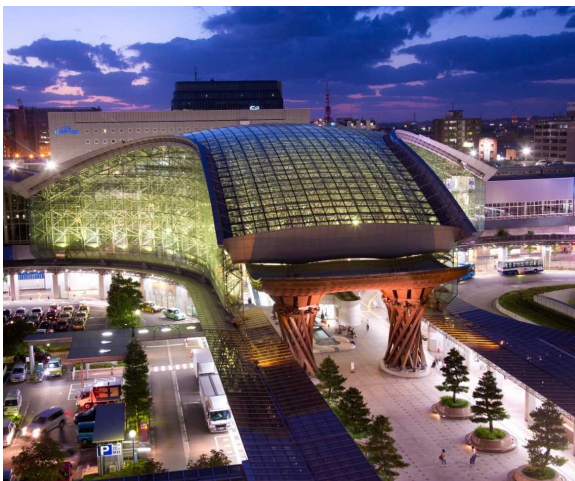
金沢駅(鼓門・もてなしドーム)