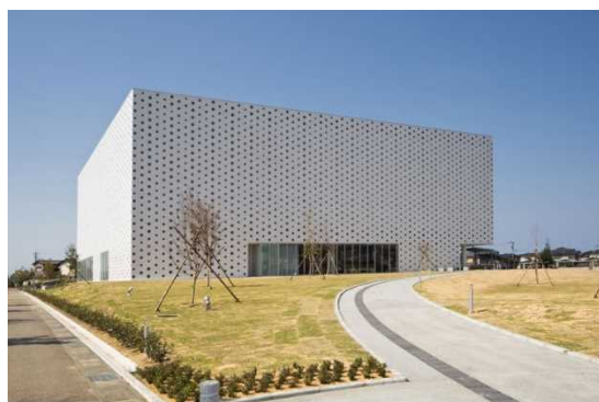
金沢海みらい図書館