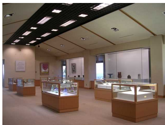
展示棟 1階 (左) 及び 2階 (右)