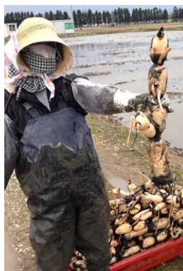
加賀れんこん 収穫体験

さつまいも、加賀れんこん、たけのこ、加賀太きゅうり、金時草、加賀つるまめ、ヘタ紫なす、源助だいこん、せり、打木赤皮甘栗かぼちゃ、金沢一本太ねぎ、二塚からしな、赤ずいき、くわい、金沢春菊