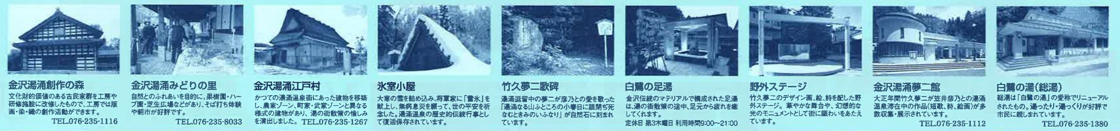
金沢湯涌創作の森 文化的価値のある古民家群を工房や研修施設に改修したもので、工房では版画・染・織の創作活動ができます。 TEL.076-235-1116